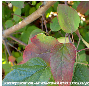
Manzano silvestre del Pacífico