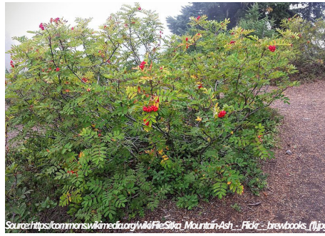
Fresno de montaña Sitka