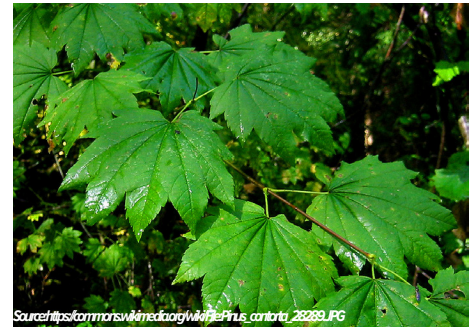
Arce de vid