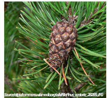
Pino de la costa